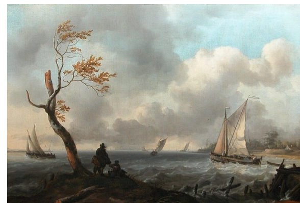
Ludolf Backhuysen, Bateau de pêche et cabotier par gros temps, 1784

Université de Lille 3, Maison de la Recherche